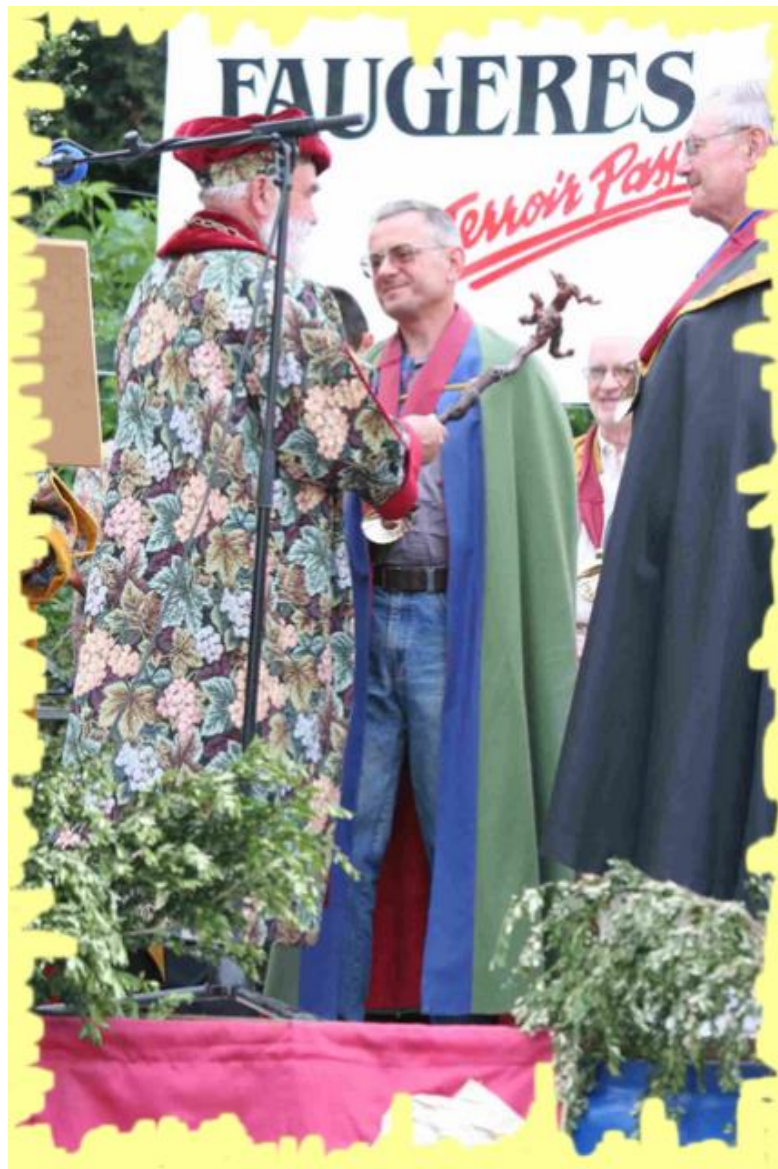
Grand St Jean 2011