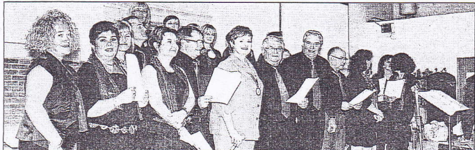
Un franc succès pour la chorale de Cazouls/Cessenon qui a chanté pour et avec Fabienne Thibeault