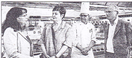
Visite du CFAI de Lézignan Corbières